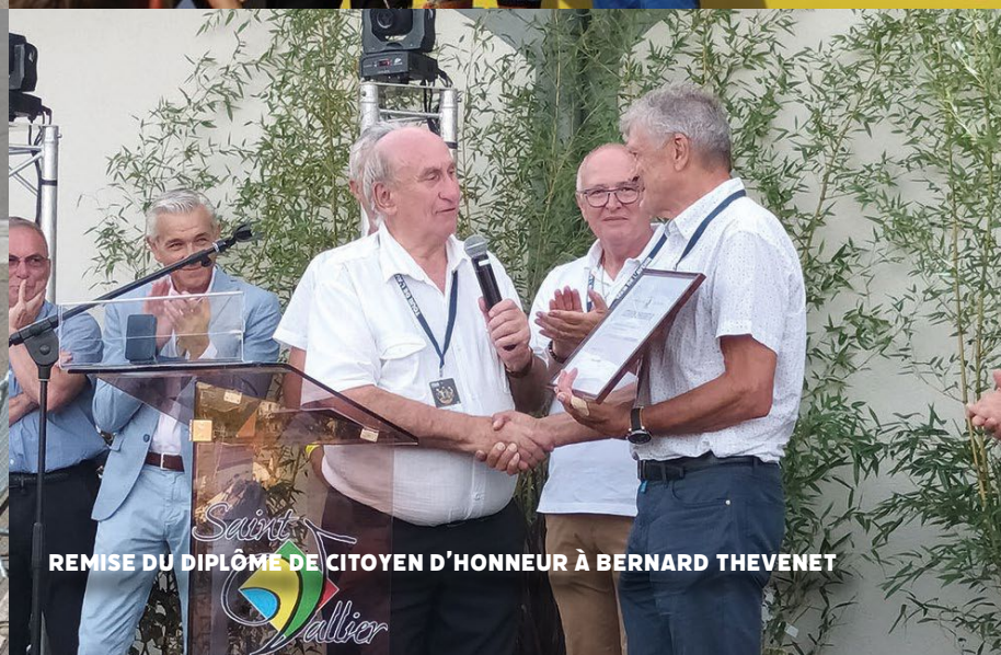
REMISE DU DIPLOME DE CITOYEN D'HONNEUR À BERNARD THEVENET