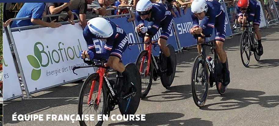
ÉQUIPE FRANÇAISE EN COURSE