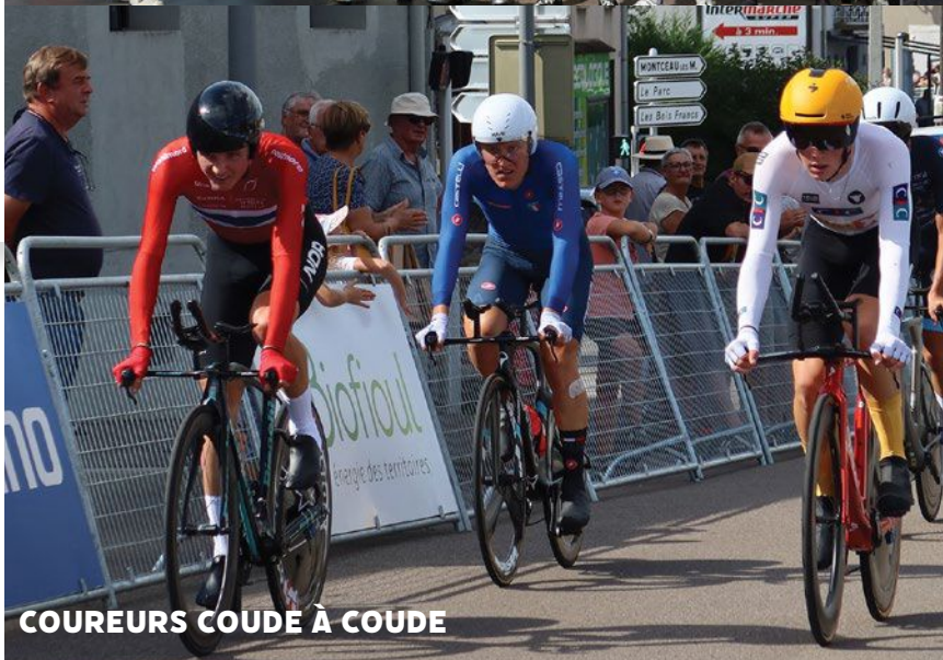
COUREURS COUDÉ À COUDÉ