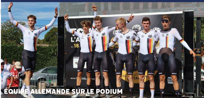
ÉQUIPE ALLEMANDE SUR LE PODIUM