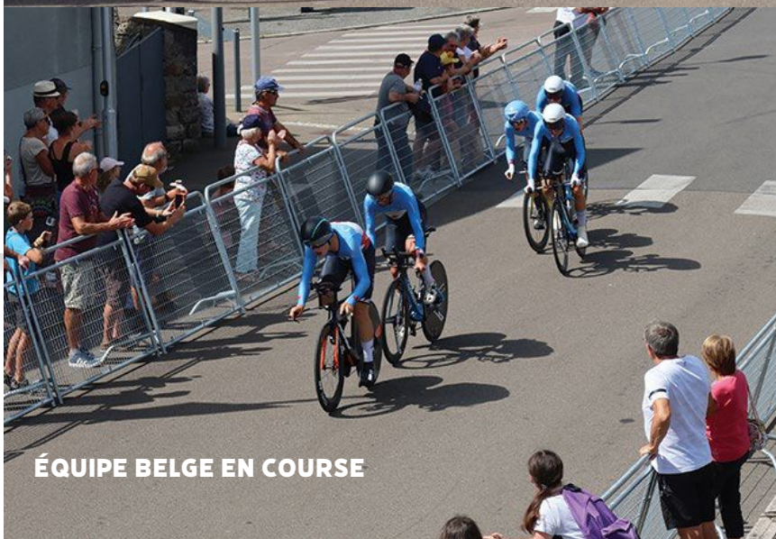
ÉQUIPE BELGE EN COURSE